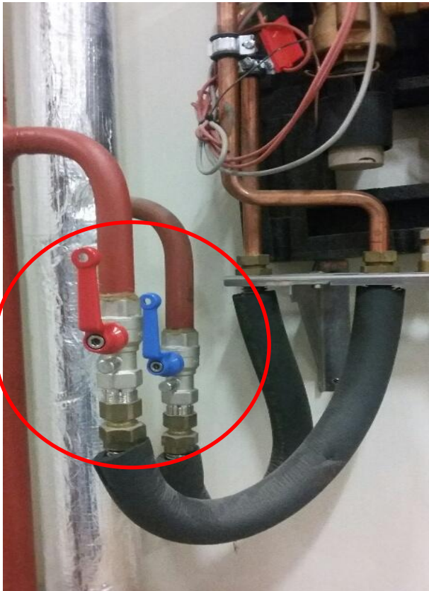
Hoogbouw, afsluiter (parallel) = OPEN