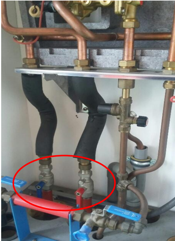
Laagbouw, afsluiter (parallel) = OPEN