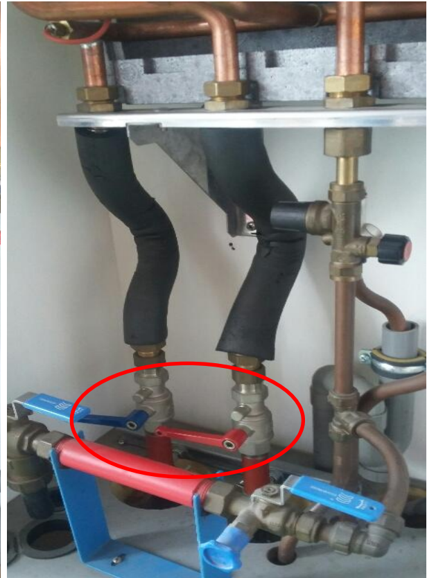
Laagbouw, afsluiter (haaks) = DICHT